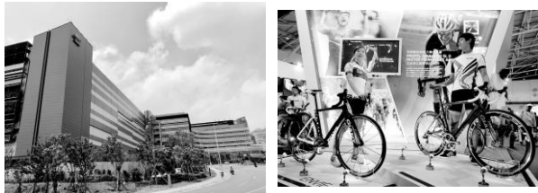
台灣積體電路製造股份有限公司 巨大機械工業股份有限公司

19. 華碩電腦股份有限公司和台灣積體電路製造股份有限公司生產的產品，屬於哪種工業類型？（請勾選）