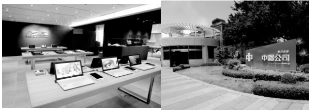
華碩電腦股份有限公司 中國鋼鐵股份有限公司