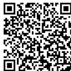
報名 QR code