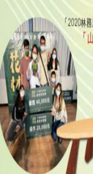
入選 「2020林務局國產材設計商品徵選活動」 「山林相連Formosa」