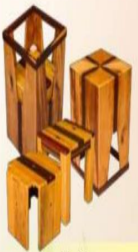
榮獲 「2015商業木材創意競賽」 全國第二名「聚.1>3」