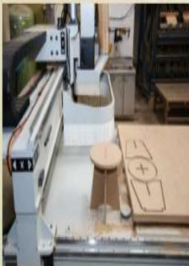
CNC加工機裝機完成後實際操作情形