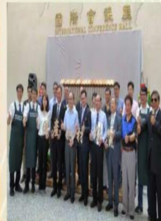
「木質層積材創意商品推廣發表會」推廣國產材的好