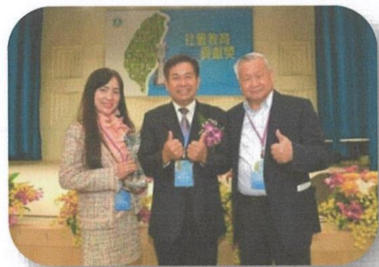
因長期致力推廣科學教育，旺宏教育基金會由教育部潘文忠部長頒授「社會教育貢獻獎」的榮耀肯定

旺宏教育基金會自2015年起，針對高中教師更持續推動「閱讀科學找樂子」及「科學教師研習營」，希望透過提供高中教師們更實質的協助，以扎根高中基礎科學教育。