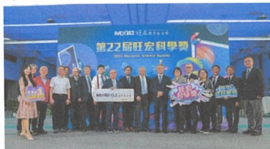
產官學研界貴賓擔任頒獎人為獲獎師生團隊傑出表現喝采