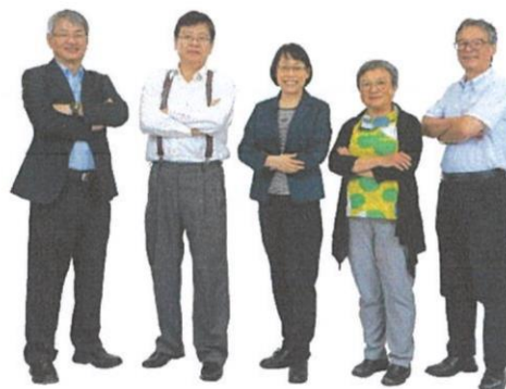
旺宏科學獎評審團陣容堅強