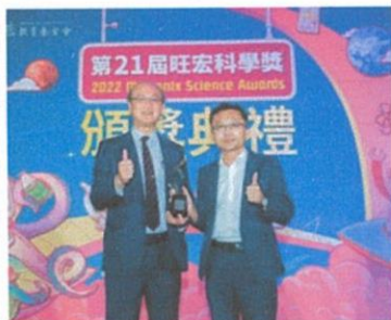
教育部次長林騰蛟多次出席活動給予指導與鼓勵