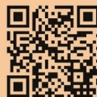
粉絲專頁 QR Code