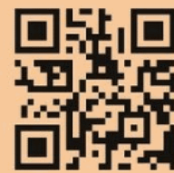
報名資訊 QR Code