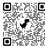
地科入門推廣研習宣傳影片