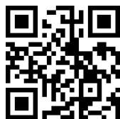
計畫 FB 粉絲專頁