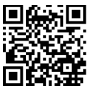
國立臺灣師範大學 科學教育中心

所有參加研習之學生需經家長或監護人同意始可報名，獲錄取者於報到時須繳交家長或監護人同意書。獲錄取者請至科學教育中心網站 http://www.sec.ntnu.edu.tw/ 下載空白表單。