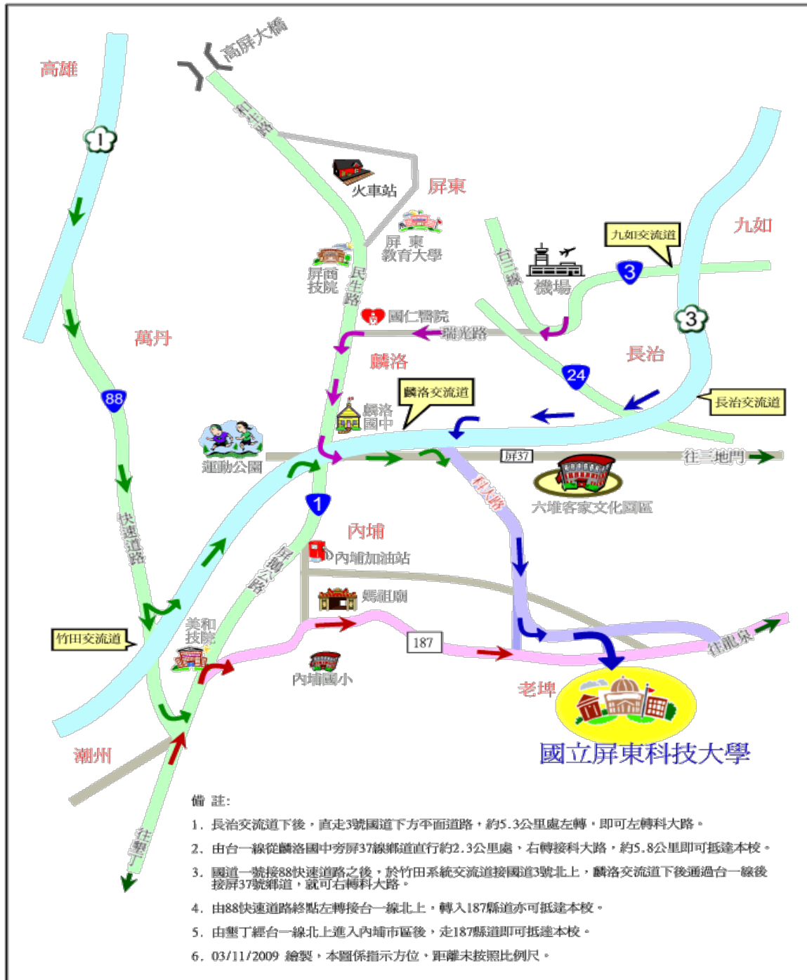
國立屏東科技大學位置示意圖