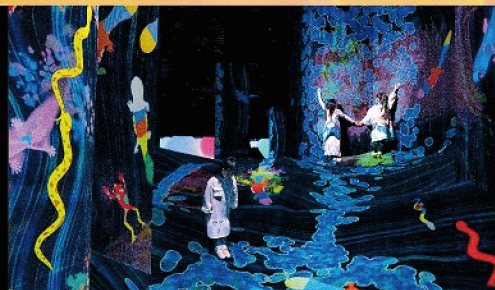
點滴瀑布, 小水滴也會形成大浪潮