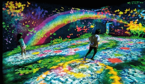
水上彈跳的天才跳房子