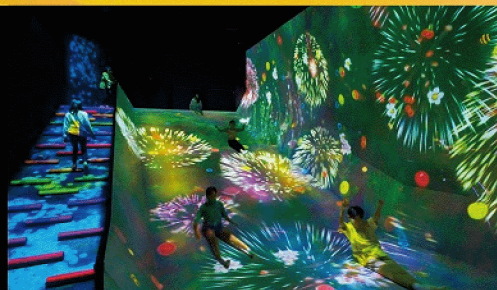
坡道上的點滴瀑布 / 滑梯水果園