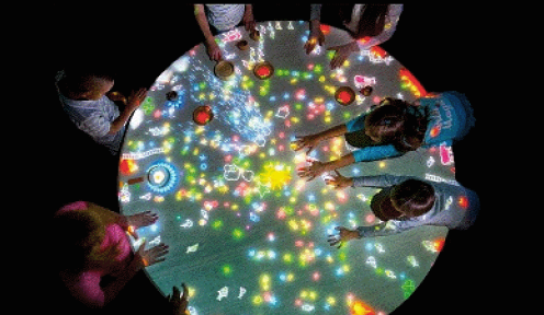
小人兒所居住的桌子 and more...

繼2022《teamLab未來遊樂園&與花共生的動物們》在台創下30萬人口碑佳績, 今年將帶來全新展覽來台, 展出以「共創」為概念、從小孩到大人都能體會樂趣的熱門作品做全新呈現, 打造互動性十足、色彩繽紛絢麗、共同創造的作品群。大家都能一起隨心所欲地畫畫、跳房子, 今夏一起來「teamLab共創! 未來園 台北」玩耍!