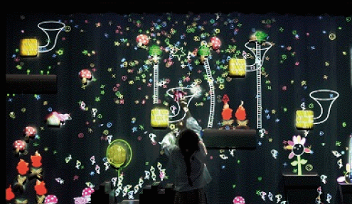
小人兒所居住的音樂牆