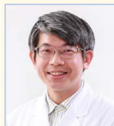
張宏名教授 台北醫學大學