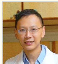
潘明楷醫師教授 台大醫學院