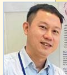
李青濤教授 台北醫學大學