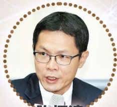
許恒達 臺灣大學法律學院教授 臺灣刑事法學會理事長