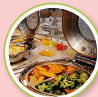
鮭魚大飯店屏東館 平日早餐吃到飽