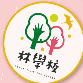
林學校體驗課程套票