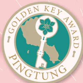
金鑰獎認證 雙人房住宿卷