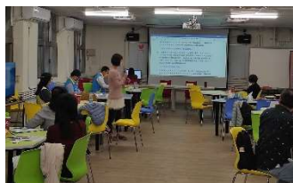
與測驗中心各科研究員進行 統測試題檢討會