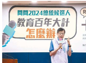
「問問2024總統候 選人：教育百年大計 怎麼辦？」