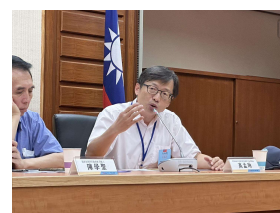
本會與1111人力銀行在立 法院共同舉辦 「科技人才教育公聽會」