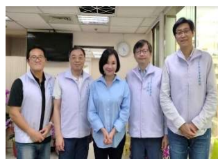
2024年3月拜會立法院第 11屆第1會期教育與文化 委員會召委