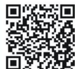
佳和非營利幼兒園(康寧)