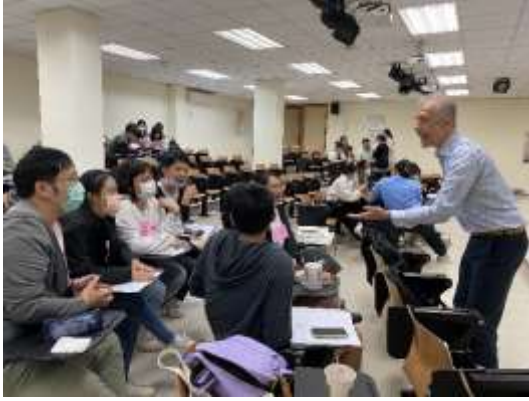
臨床情境模擬演練