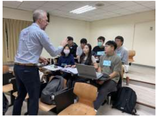
臨床情境模擬演練