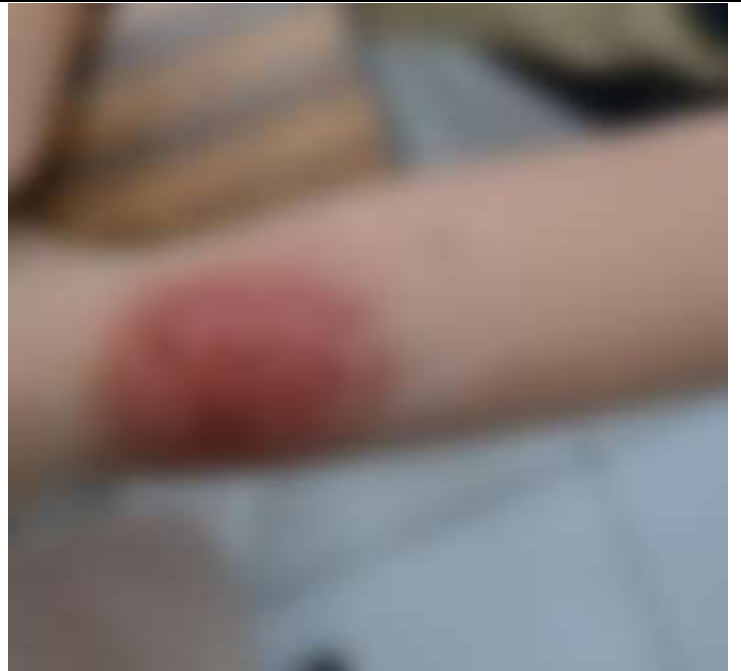
擦傷(示範圖，已模糊處理)