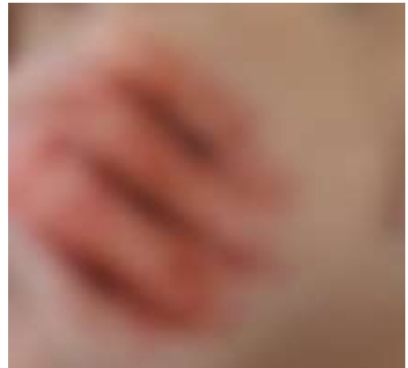
抓傷(示範圖，已模糊處理)