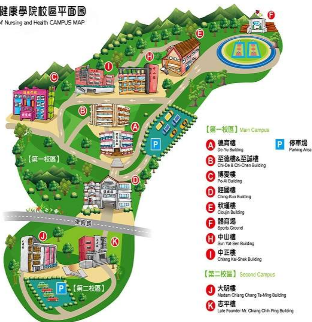
德育護理健康學院校區平面圖 Deh Yu College of Nursing and Health CAMPUS MAP