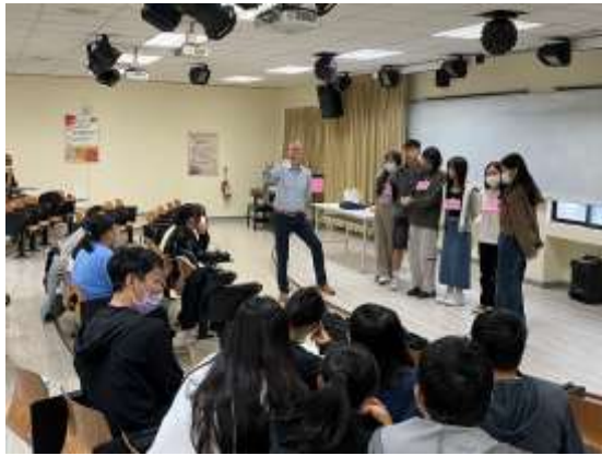
臨床情境模擬演練