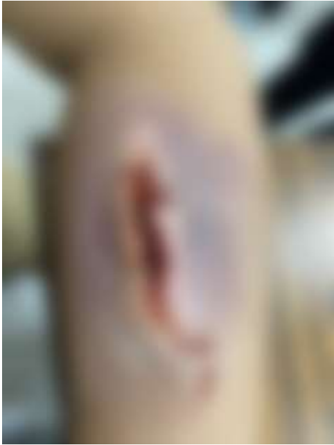
撕裂傷(示範圖，已模糊處理)