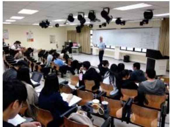
臨床情境模擬演練