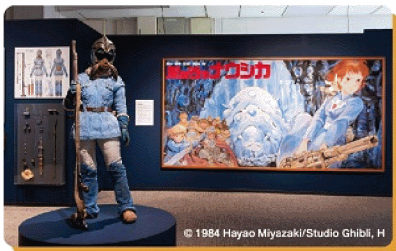
© 1984 Hayao Miyazaki/Studio Ghibli, H