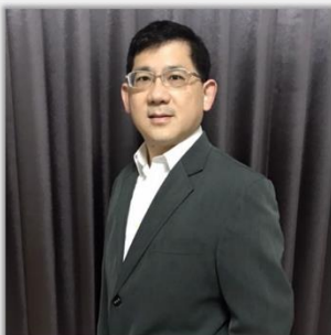
林崇青 國立成功大學經濟系 台灣經濟學會理事長