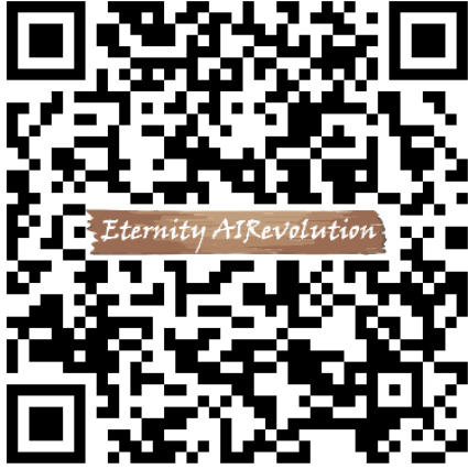
▲ Instagram 粉絲專頁