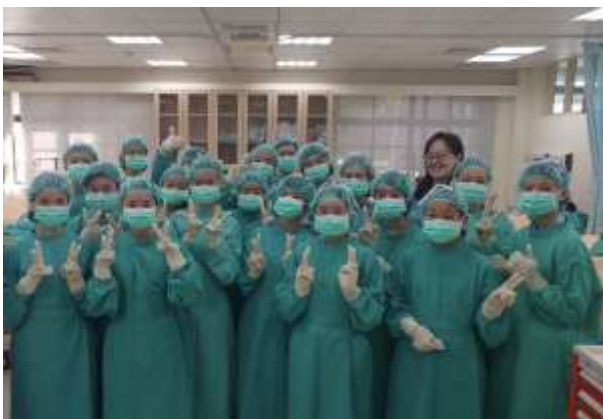
手術衣帽穿著(演練示範圖)