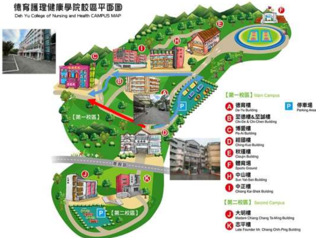
德育護理健康學院校區平面圖 Deh Yu College of Nursing and Health CAMPUS MAP