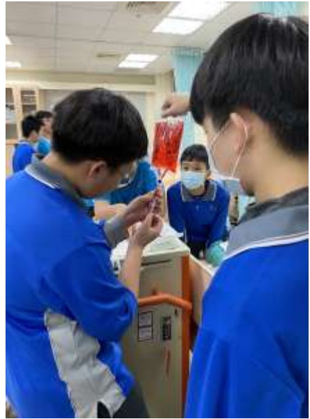
藥物抽取(演練現場)