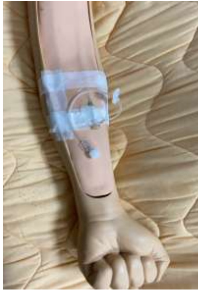
靜脈留置針(模型示範圖)