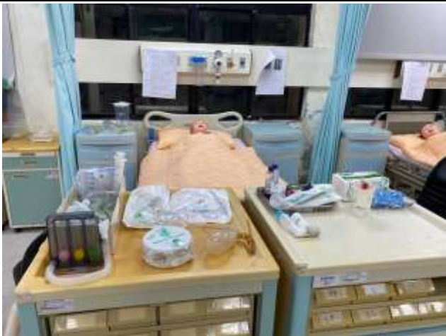
外科照護器材(演練現場)