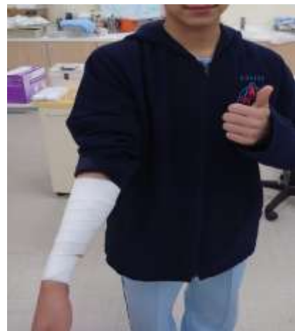
繃帶包紮(操作示範圖)