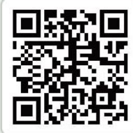
114學年度會法專班 說明會報名表單

書面資料審查40%；口試60% 簡章下載：114年2月13日公告 複試(口試)時間：114年5月10日(六)