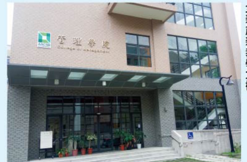
全新創新教學大樓