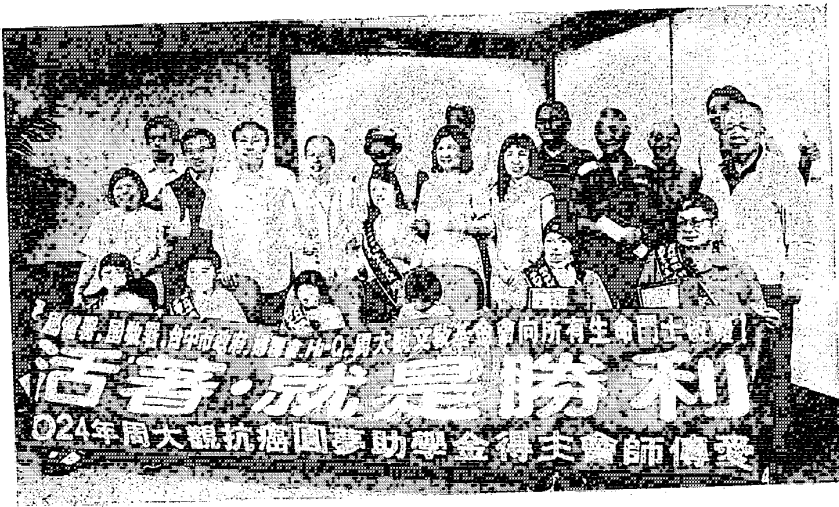
↑周大觀文教基金會頒發助學金給六位抗癌勇士。