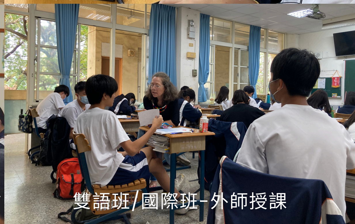
雙語班/國際班-外師授課