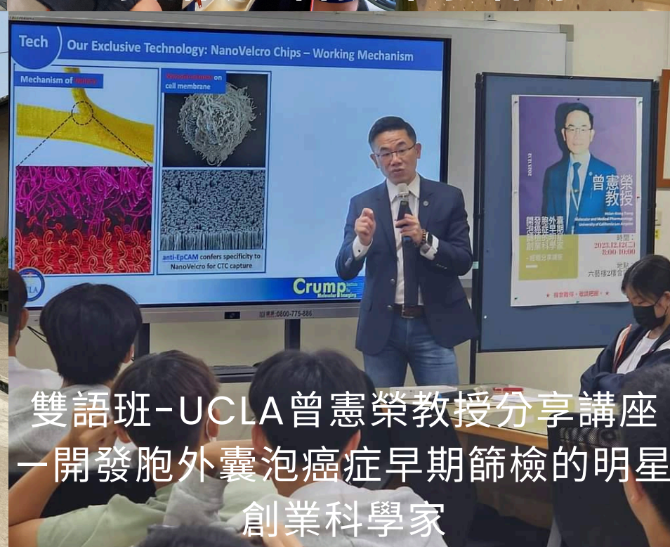
雙語班-UCLA曾憲榮教授分享講座 —開發胞外囊泡癌症早期篩檢的明星 創業科學家