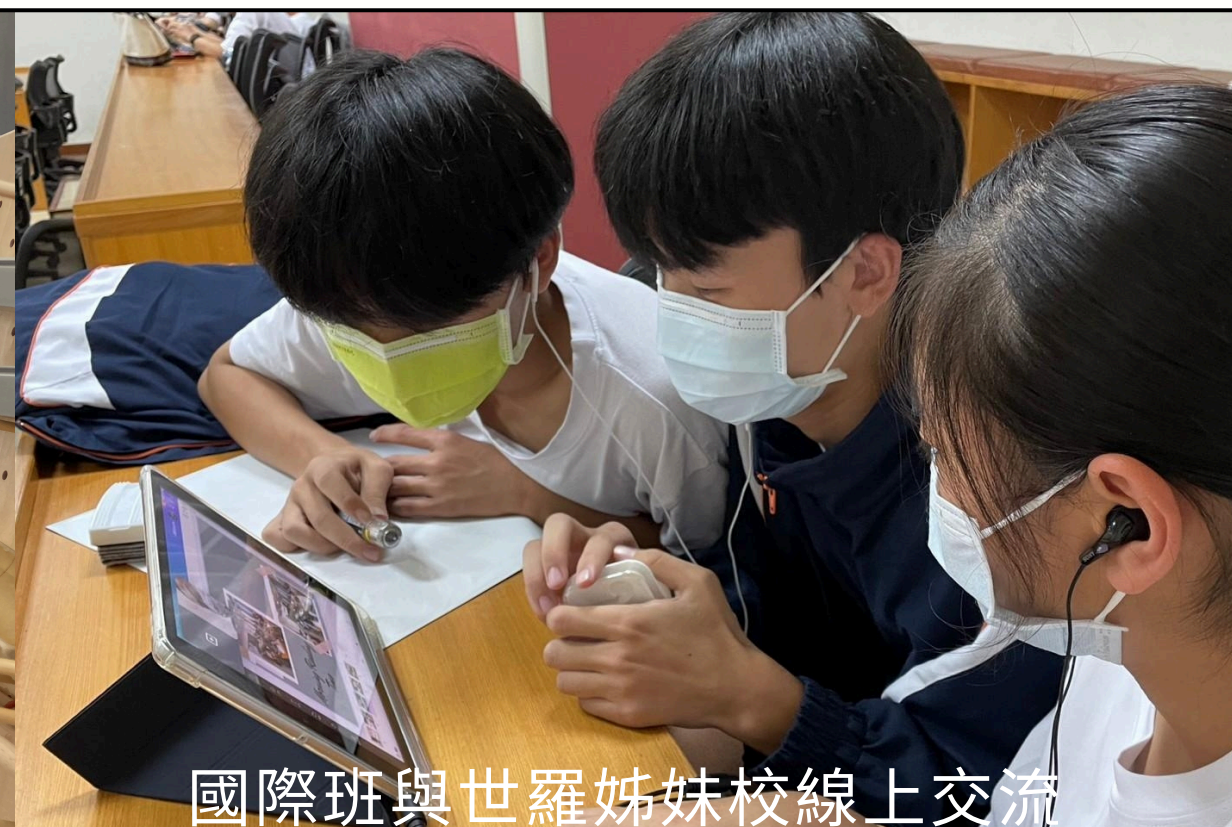
國際班與世羅姊妹校線上交流