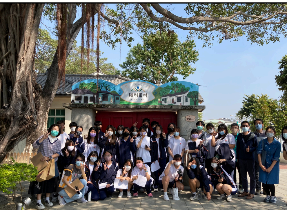
國際班-勝利星村英語導覽