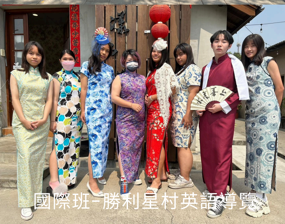
國際班-勝利星村英語導覽