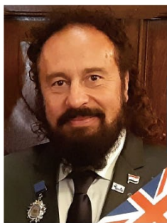
President of the International Jury