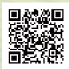
教育部終身教育司