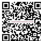
生物科學營影片簡介