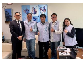
2025年3月拜會教育及文 化委員會召委