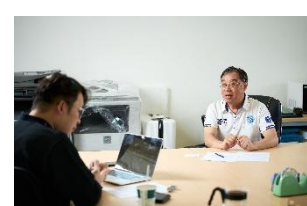
本會接受媒體採訪：討論校園 菸酒防制、反毒、霸凌防制