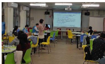
與測驗中心各科研究員進行 統測試題檢討會