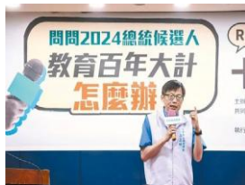
「問問 2024 總統候選人： 教育百年大計 怎麼辦？」