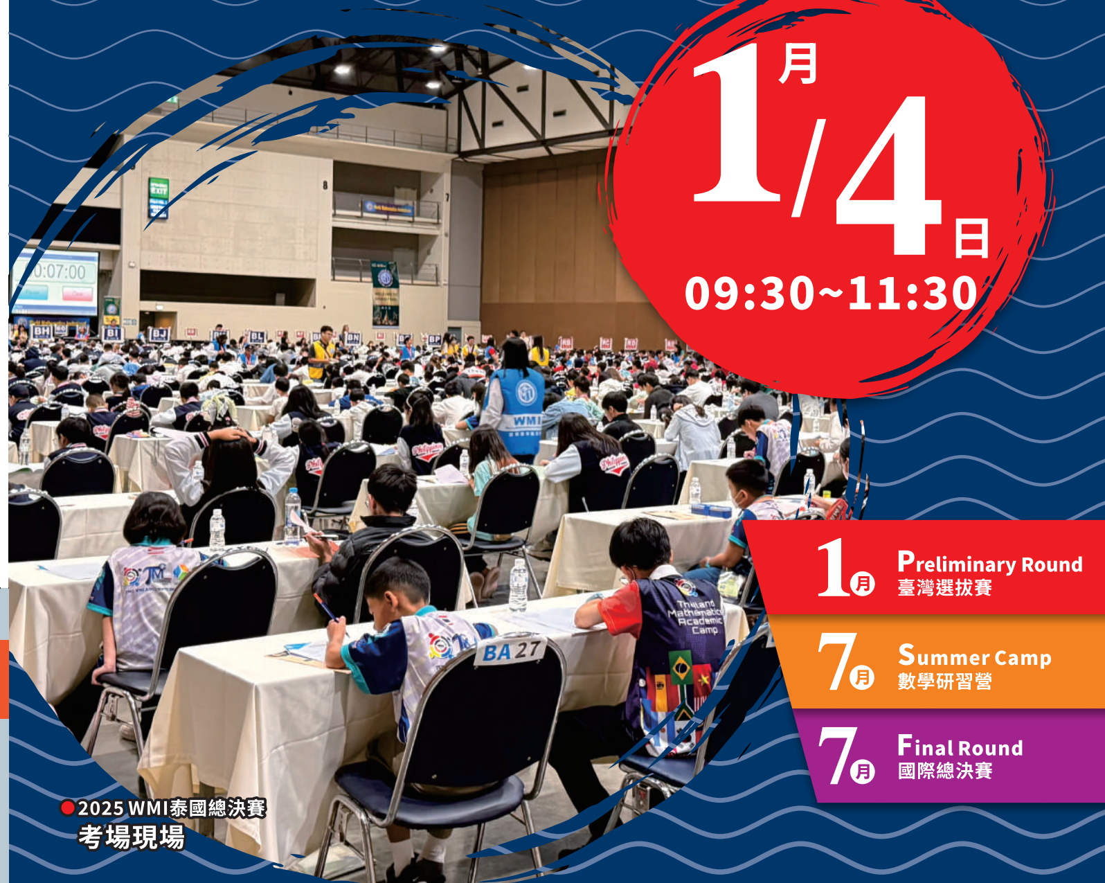
● 2025 WMI泰國總決賽 考場現場