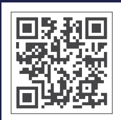
招生入學資訊請掃描 QR-Code

* 美術學系(乙類)及新媒體藝術學系考生，請務必報考大學術科考試委員會聯合會「術科考試—美術組」考