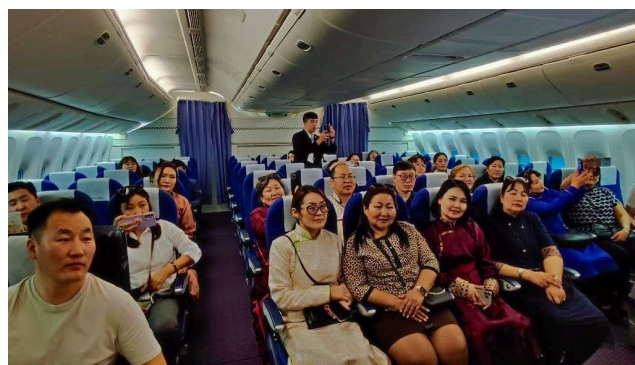
波音 B777 飛航情境模擬機