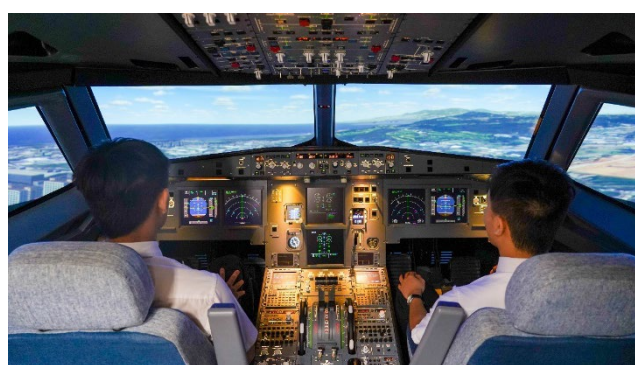
空中巴士 A320 模擬機