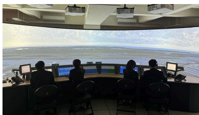
航管塔台與雷達模擬教室

九、報名網址： https://forms.gle/BPPVP8svgQUd9pw76 /聯絡信箱： cadfcyut@gmail.com