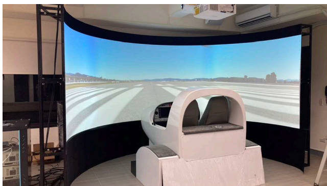
DA40/42 單引擎與雙引擎螺旋槳模擬機各一