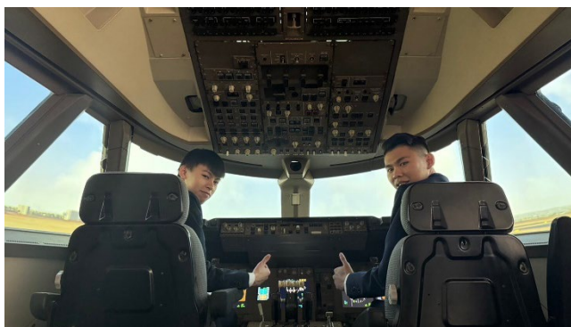
波音 B747-400 模擬機