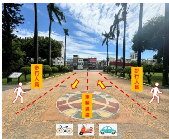
圖1：學校大門人車分流指引

八、為維護校園安全與落實門禁管理，學生進出校園請穿著學校校服(制服或運動服)並攜帶本校書包(側背或肩背均可)。