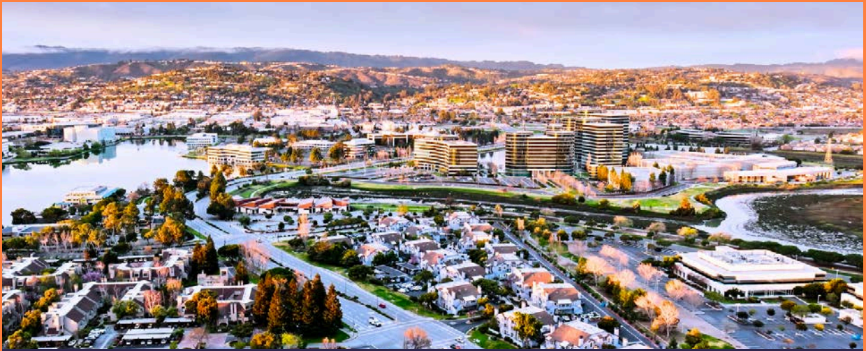
矽谷之旅 Silicon Valley