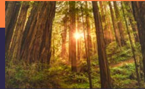
穆爾國家森林公園