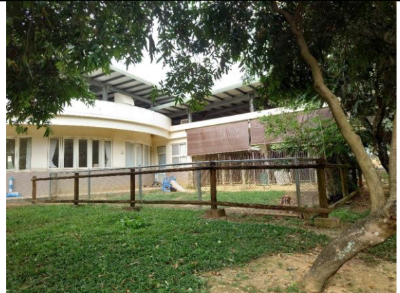
狗狗散放草地外觀