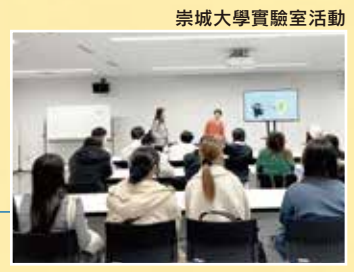
崇城大學實驗室活動