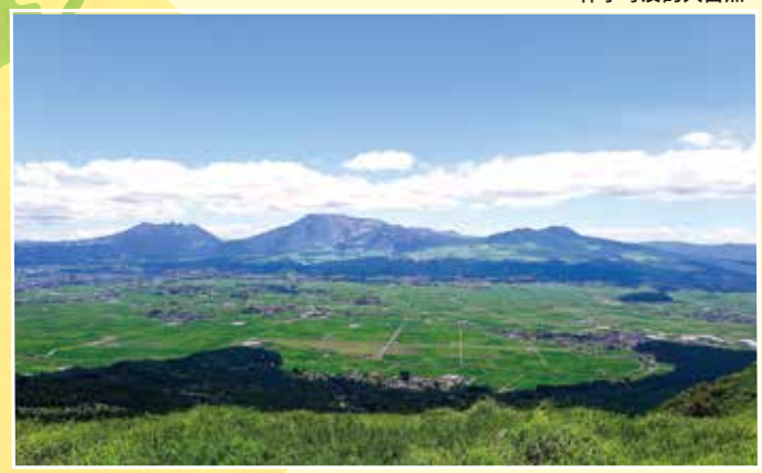
伸手可及的大自然

此活動的最大魅力是不僅限於學習的「活生生的日本」體驗。享受新鮮飲食文化，與溫暖當地人接觸，一邊親身感受熊本社會與教育。這裡度過的時光，將成為加深日本理解的一生珍寶。