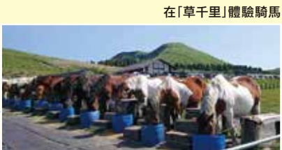
在「草千里」體驗騎馬