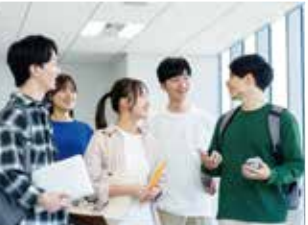
熱情友善的熊本人