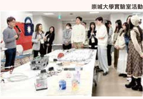
崇城大學實驗室活動

修了本活動的參加者，將授予結業證書(Certificate of Completion)。此結業證書是日本國際交流活動與文化體驗的證明，可用於學校活動記錄或未來升學活動等。