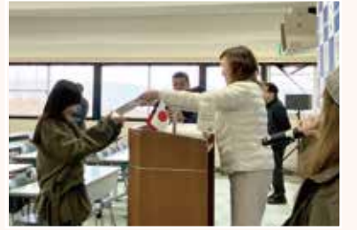
修了證書頒授儀式

此活動是認識熊本的第一步。直接體驗學生生活與日本文化，擴大你的未來可能性。熊本有許多學習場所，也具備完善的環境來磨練專業技能。在這片土地，擴展未來可能性吧。