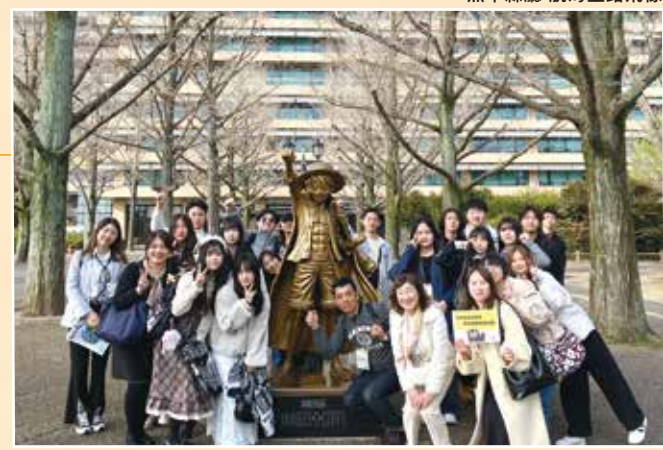
熊本縣廳 航海王路飛像

參加學生透過與當地學生交流、文化體驗、觀光等，親身感受熊本生活。雖然是短期停留，但接觸實際學校生活，加深對日本的理解，許多學生回答「想再來熊本」「想在熊本學習」。