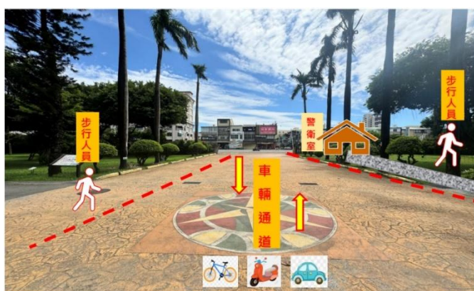
圖1：學校大門人車分流指引

八、為維護校園安全與落實門禁管理，學生進出校園請穿著學校校服(制服或運動服)並攜帶本校書包(側背或肩背均可)。