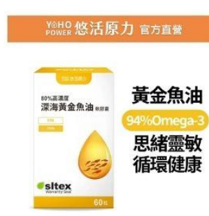
悠活深海黃金魚油 直降1.5%員購價：$787