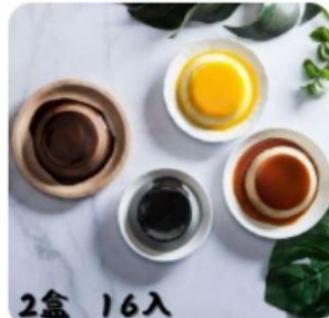
依蕾特 經典口味布任選2盒 直降1.5%員購價：$687