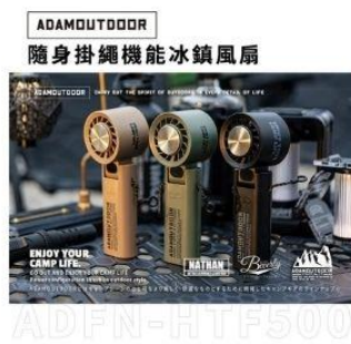
戶外兩用USB冰鎮風扇 直降1.5%員購價：$684