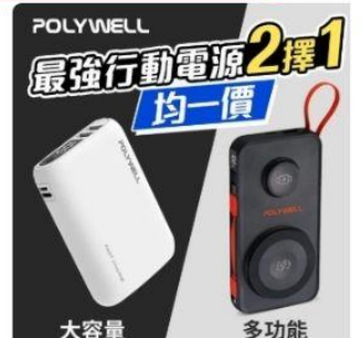
POLYWELL磁吸無線充電 直降1.5%員購價：$590