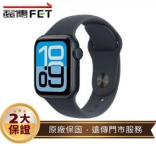
Apple Watch SE3 GPS 40mm 直降1.5%員購價：$7,244