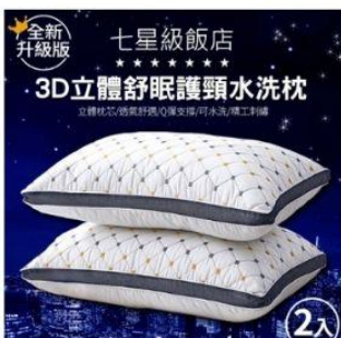
7星級飯店3D立體水洗枕 直降1.5%員購價：$519