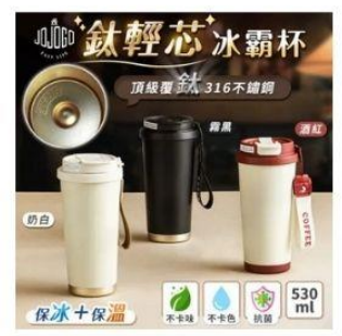
買一送一 鈦輕芯冰霸杯 直降1.5%員購價：$490