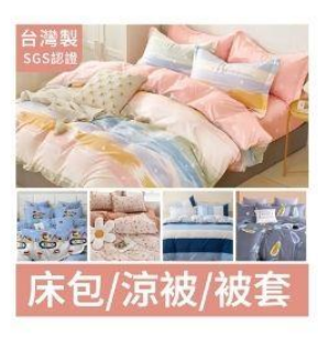
台灣製 雙人床包枕套組 直降1.5%員購價：$263