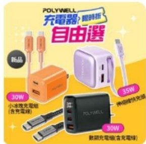
PD快充頭【任選】 直降1.5%員購價：$491