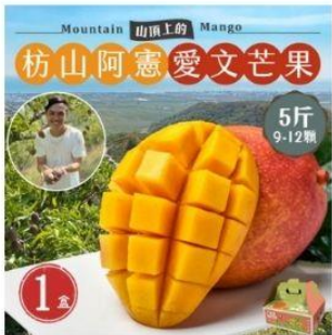
愛文芒果禮盒5斤9-12顆 直降1.5%員購價：$460