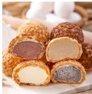
豆酥朋招牌綜合泡芙3盒 直降1.5%員購價：$591