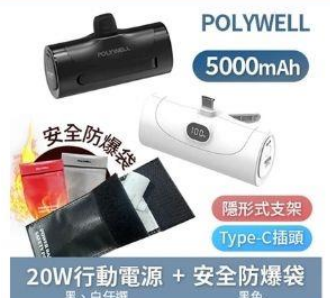
POLYWELL 20W行動電源 直降1.5%員購價：$491