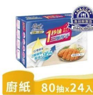
春風三層厚手廚房紙巾 直降1.5%員購價：$521