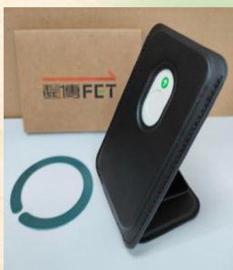
磁吸卡包手機支架

5月底前加入好友即有抽獎資格 員工及眷屬皆可參加 另有員眷隱藏版電信優惠,歡迎詢問!