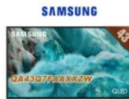
三星43型 QLED 4K Vision AI智慧顯示器 直降1.5%員購價：$13,502