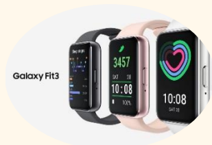
三星Galaxy Fit3 智慧手環 (售價:$2,680)