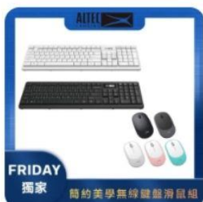
簡約美學無線鍵盤滑鼠組 直降1.5%員購價：$393