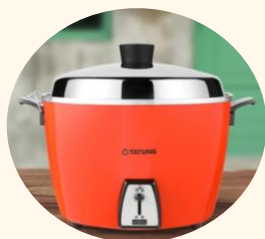
大同10人份電鍋 (售價:$3,390)