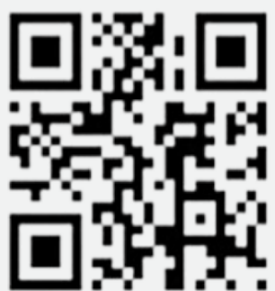
報名資訊 QR Code